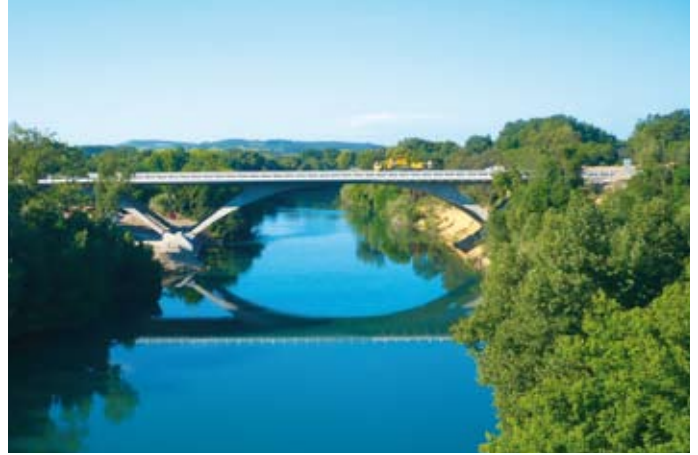
Le pont de béton du 21 e siècle.

Le premier pont, inscrit à l'inventaire des Monuments Historiques, est dû au dessin de l'architecte Bertrand Garipuy. Considéré comme l'un des architectes et ingénieurs les plus doués de son temps, Bertrand Garipuy était le fils de François Garipuy, directeur des travaux de la Province du Languedoc, au XVIII e siècle. C'est à l'âge de 26 ans, en 1774, que le jeune maître d'œuvre conçut le projet d'un pont de pierre, en grand appareil, d'une seule arche et d'une portée de près de 50 mètres. Les Etats voulaient améliorer les conditions de circulation sur la route royale passant par le Massif Central et allant de Montpellier à Paris. Très doué, il avait déjà réalisé plusieurs ouvrages remarquables. Il commença la construction en 1778 et très vite, les difficultés s'accumulèrent. Impétuosité du fleuve, mauvais sol sur la rive gauche, querelles locales... Avant d'exécuter le pont de Gignac, Bertrand Garipuy construisit en 1777-78, le pont de Lamoux, véritable maquette au 1/6 e , près de St Félix de Lodez. Ce pont existe toujours et en constitue le prototype. La Révolution