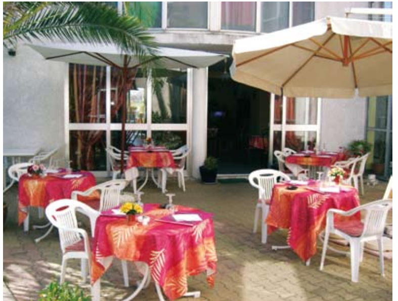
L'Hôtel « Les Jardins d'Isis ».

et de Saint-Guilhem-le-Désert sont une opportunité formidable pour St-André : cela va attirer des touristes du monde entier. C'est le moment de développer de l'hébergement ! Si on aime le contact et la relation avec les autres, c'est une activité très agréable. Il y a tous les services nécessaires dans le village pour satisfaire les touristes : services de santé, commerces, restaurants, bars, nombreux