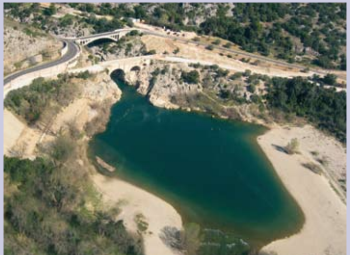
Le Pont du Diable