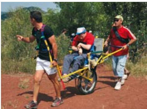
Promenade en Joëlette au bord du Salagou.