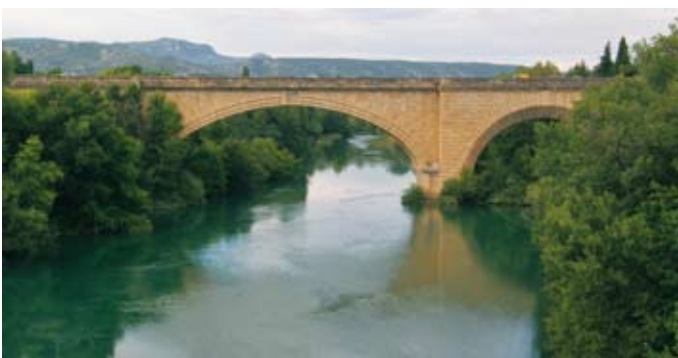
Le pont de pierre du 18 e siècle.

Plus de deux siècles séparent la construction de ces deux ouvrages, sur le même site et à quelques centaines de mètres de distance. Leur réalisation fut marquée curieusement par les mêmes difficultés de sol instable et par la disparition prématurée de leurs concepteurs. La mise en valeur des berges de l'Hérault, souhaitée pour le plaisir de tous, passe par la redécouverte de ce patrimoine remarquable.